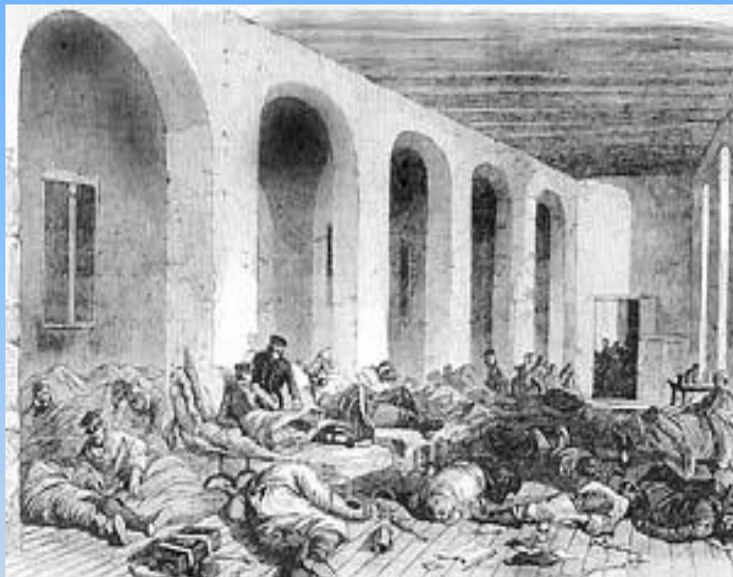
Antes de Florence