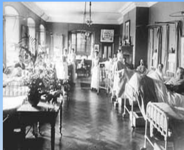
Depois de Florence

“A primeira condição do hospital é não prejudicar o doente” Florence