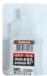
Cloreto de Potássio