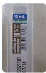
Sulfato de Magnésio