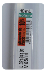
Gluconato de Cálcio