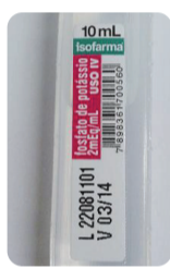
Fosfato de Potássio