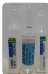
Glicose Ampola 20 ml