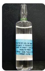
Cloreto de Cálcio