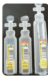
Cloreto de Sódio