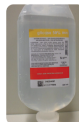
Glicose Frasco 500 ml