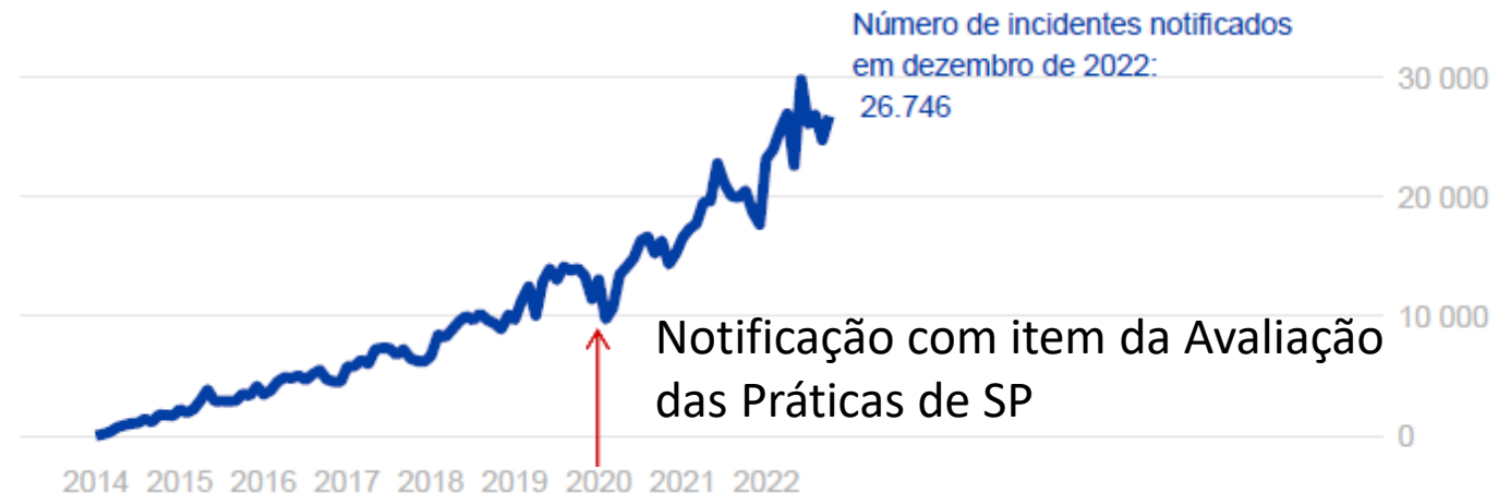
Número de incidentes notificados por mês. Brasil, 2014 a 2022.