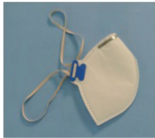
Figura 2: Exemplos de peças semifaciais filtrantes PFF2