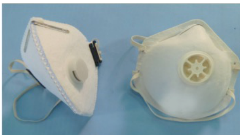
Figura 5 : Exemplos de PFF com válvula de exalação

Os modelos de PFF com válvula de exalação são considerados mais confortáveis, pois a maior parte do ar expirado, quente e úmido, sai pela válvula, não aquecendo e umedecendo a camada filtrante. Entretanto, não devem ser usados para trabalhos em campo estéril, como, por exemplo, em centros cirúrgicos, pois o ar exalado pelo usuário sai pela válvula de exalação e, se o usuário estiver contaminado com algum patógeno, o ambiente será contaminado. Quando existe necessidade de proteção adicional contra a projeção de sangue ou outros fluidos corpóreos que possam atingir o rosto do trabalhador de saúde, deve-se utilizar um anteparo do tipo protetor facial sobre a PFF ou óculos de segurança e PFF resistente à projeção de fluidos corpóreos.