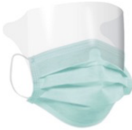
Figura 1: Máscara cirúrgica

Os aerossóis são constituídos por partículas com tamanho menor ou igual a 5 \mu\text{m} . A proteção respiratória para as doenças com transmissão aérea por aerossol (como, por exemplo, a tuberculose pulmonar e laríngea, o sarampo, a varicela, a SARS e a gripe aviária) é obtida através da seleção e do uso dos EPRs adequados. Como as partículas que constituem os aerossóis são muito pequenas, elas permanecem em suspensão por longos períodos de tempo, podendo se dispersar por longas distâncias.